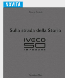
IVECO 50 Sulla strada della storia € 55,00