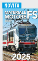
Materiale Motore FS € 23,00