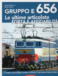
Gruppo E 656 Le ultime articolate FORZA e AFFIDABILITÀ € 59,00