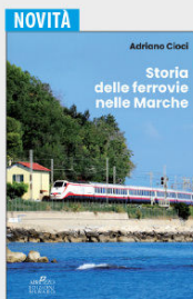
Storia delle ferrovie nelle Marche € 25,00