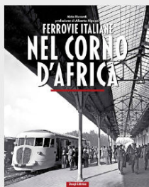
Ferrovie italiane nel Corno d'Africa € 45,00